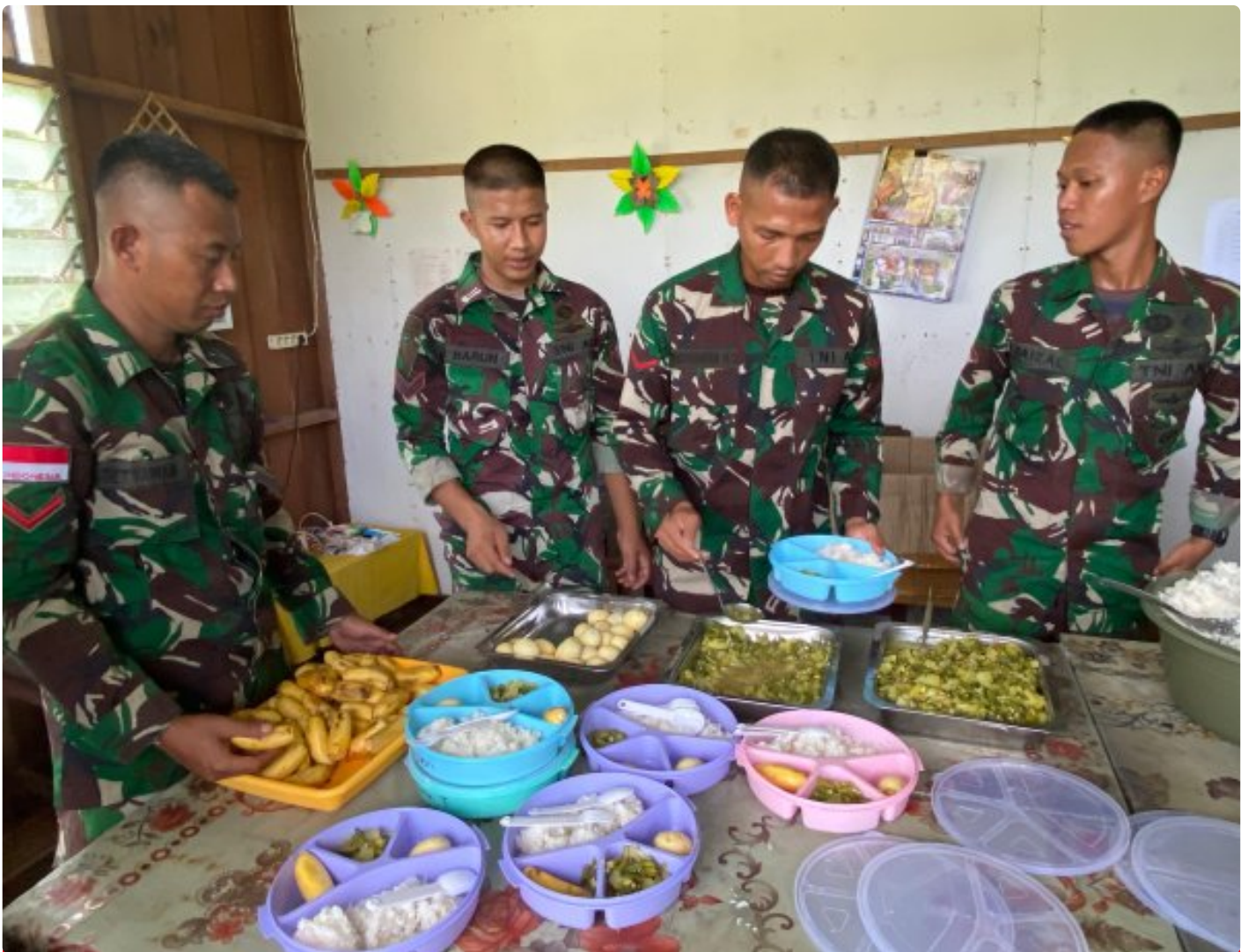
Foto: Dedikasi Satgas Pamtas Mobile RI-PNG Yonif 503/Mayangkara dalam mendukung program makan bergizi gratis pemerintah mendapat apresiasi tinggi dari masyarakat Distrik Krepkuri, Kabupaten Nduga, Papua, di sekolah